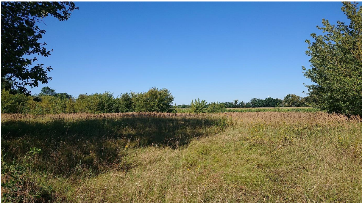
Abbildung 2: Die Untersuchungsfläche mit starken Aufwuchs