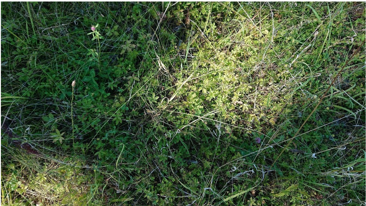
Abbildung 4: Das Gänse- Fingerkraut ( Potentilla anserina ) ist großflächig vertreten und verhindert geeignete Strukturen für Reptilien.