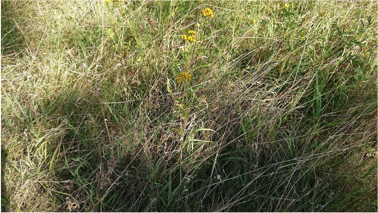
Abbildung 3: Die gesamte Fläche ist mit mehrjährigem Aufwuchs stark „verfilzt“. Der Boden ist großflächig stark beschattet.